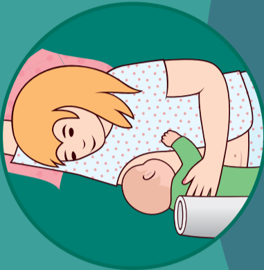
Stillen im Liegen